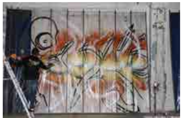
MG La Bomba