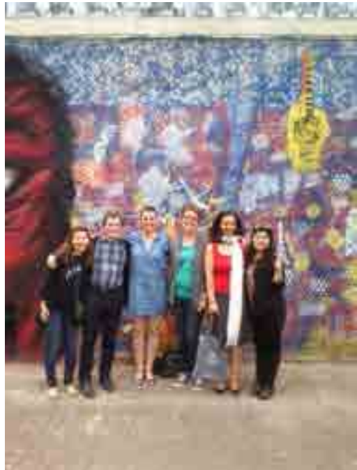
L'équipe d'animation du Café des Langues

« Nous nous inscrivons dans l'idée qu'on cherche les voies pour bâtir un monde meilleur, autour de nous, qui nous rende plus altruiste, plus ouvert à l'étrangeté et à autrui. » « Causerie autour d'une langue : invitation à l'écoute d'une langue, sur un thème choisi, interview d'une personnalité, accompagnement musical et sonore, rencontres culturelles autour de plusieurs langues, sur le principe d'une table par langue : découverte des sonorités, échanges, esprit polyglotte.