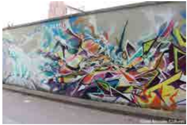
Bandi & Takt