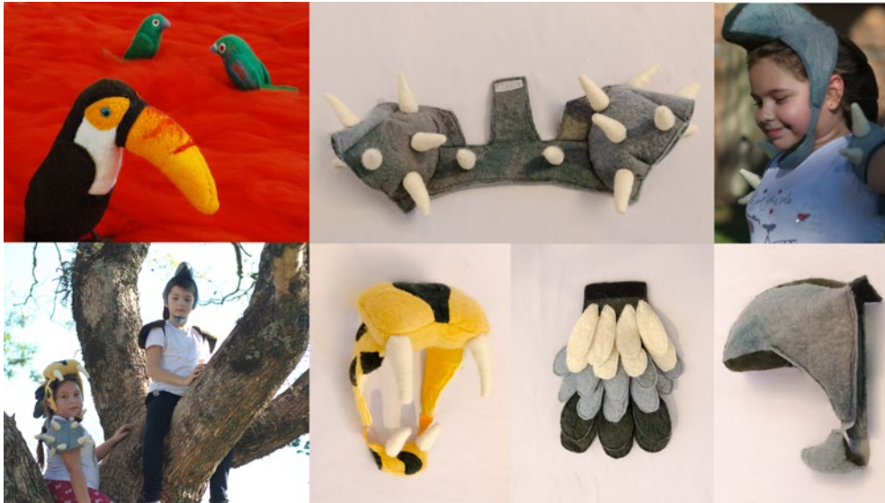
Figura 19 Proyecto Mostros. Detalles e inspiración. Fuente: Collage fotográfico realizado por Natalia Baudoin a partir de las fotografías de la Universidad de Misiones.