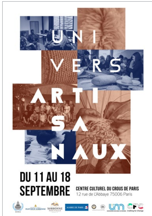
Figura 16 Añiche Muestra de París. Fuente: Le Centre Culturel du Crous du Paris .

por Motassim. Este momento fue importante para los artesanos presentes ya que pudieron ver de manera muy concreta los resultados de sus intercambios con los estudiantes. El hecho de que su trabajo estaba expuesto era un factor de orgullo.