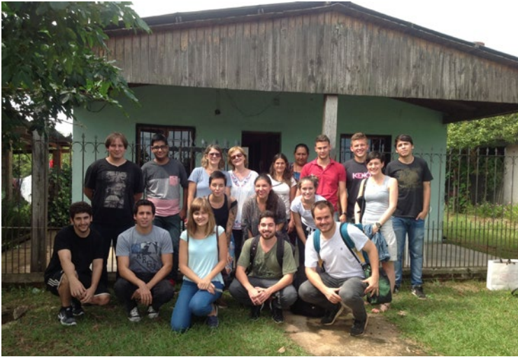
Figura 10 Primer encuentro previo al inicio de actividades del taller misionero.

tenía un interés particular en trabajar indumentaria y accesorios. A partir de ese encuentro, se armaron los diferentes grupos de trabajo por afinidad. 21