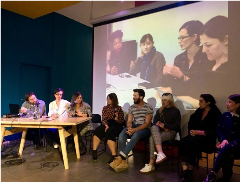
Figura 15 Coloquio Universos Artesanales. Los estudiantes de Francia y Argentina están dando testimonio de su experiencia en los talleres de creación participativa.

Se presentó también una mesa redonda en la que debatimos con el equipo docente del proyecto la pregunta “¿qué es lo que el diseño ve en las prácticas artesanales y que es lo que los diseñadores pueden aportar a los artesanos?”. Finalmente, los diseñadores ayudantes de cátedra del taller misionero presentaron el proyecto de extensión Pingos. Diseño y praxis en el territorio describiendo las acciones de la facultad de diseño de la Universidad Nacional de Misiones en el territorio misionero.