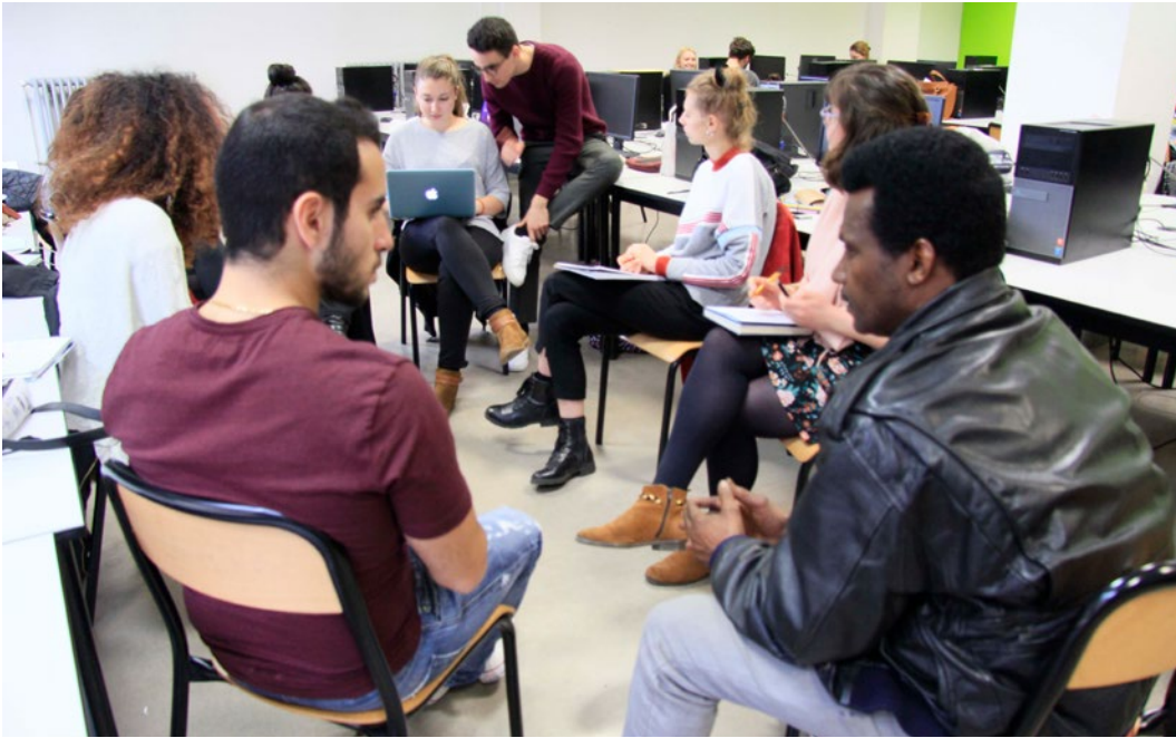
Figura 6 Taller parisino. Estudiantes de diseño y artesano con su traductor.

En esta fase los estudiantes tuvieron que: