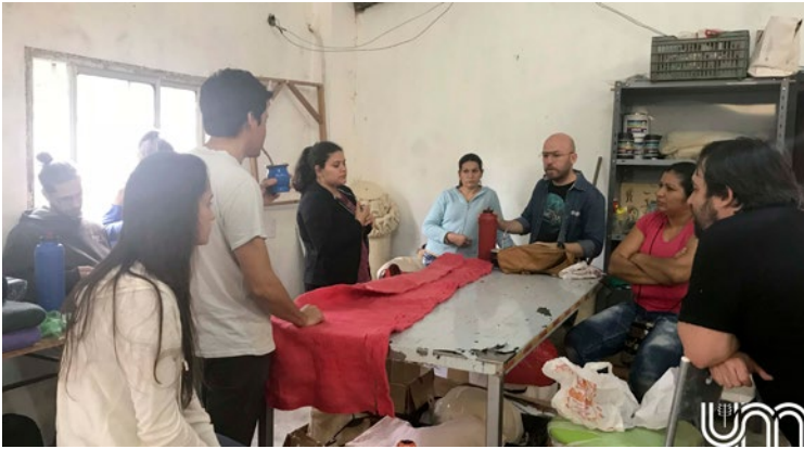
Figura 12 Sesión de trabajo en el taller de Lanas de Misiones.