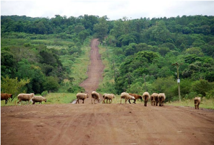
Figura 9 Camino a Profundidad y Fachinal.