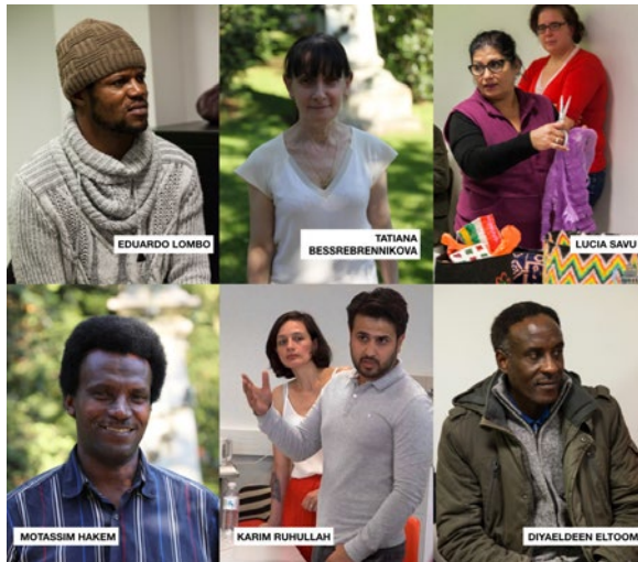
Figura 4 Artesanos migrantes.

Debido a los contextos geopolíticos específicos propios de cada taller y a las condiciones materiales en las que se desarrollaron los mismos, las dinámicas de intercambio que se crearon fueron también específicas.