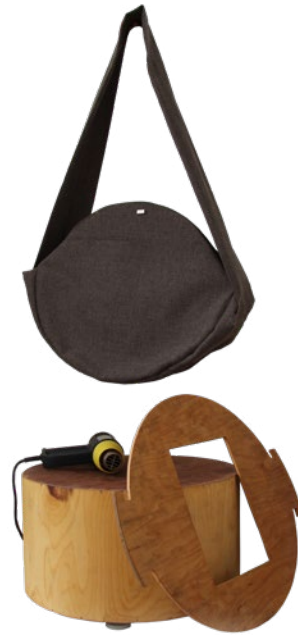
Figura 3 Thermo mobile.

en torno a la resolución de las dificultades técnicas a las que se enfrentaban. Específicamente, un grupo diseñó un mueble cuya estructura funcionaba como telar, permitiendo el tejido del asiento directamente en el mismo (Figura 2).