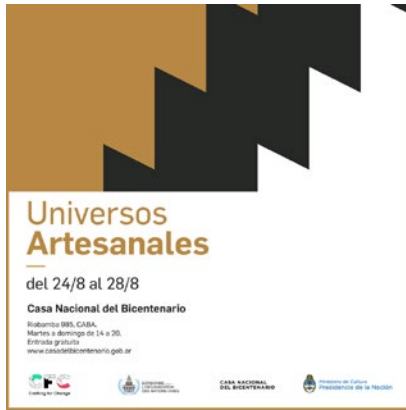
Figura 14 Afiche de la muestra de Buenos Aires.