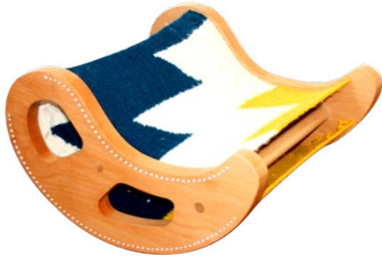
Figura 2 Fasila.