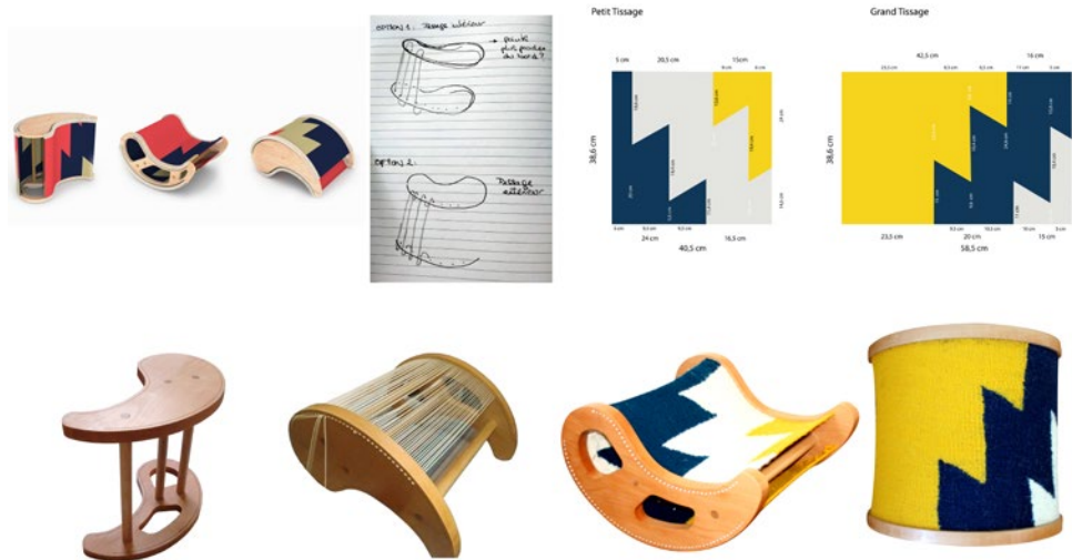
Figura 18 Etapas de desarrollo del proyecto Fasila .

objeto era a la vez la herramienta que servía para su fabricación y el objeto final. Esta operación resolvería dos problemas: por un lado, la falta de herramienta de trabajo (el objeto funciona como herramienta) y por otro lado resolvería el acople de la tapicería al objeto.