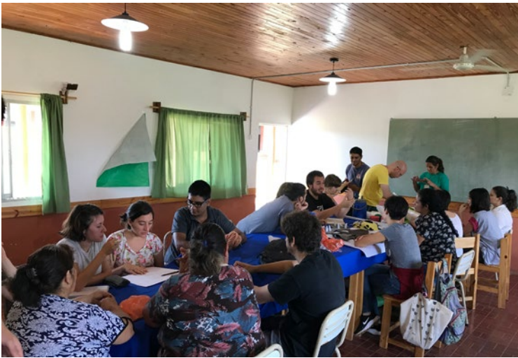
Figura 11 Espacios de convivencia en el salón de usos múltiples de la municipalidad de Fachinal.

El vínculo profesional se daba en el espacio de taller, en el que las artesanas transmitían sus conocimientos técnicos a los estudiantes, mientras que los estudiantes de diseño les enseñaban a leer planos, hacer maquetas, etc. El taller era un espacio de experimentación y de creación conjunta para las artesanas y para los estudiantes. Los estudiantes aprendieron a hacer paños y pelotitas de fieltro y las artesanas aprendieron a trabajar con patrones y moldería de costura para la realización de los objetos proyectados (Figura 12). Se creó una relación de complicidad entre las artesanas y los estudiantes a través de la comunicación gestual y verbal que se instaló en el taller.